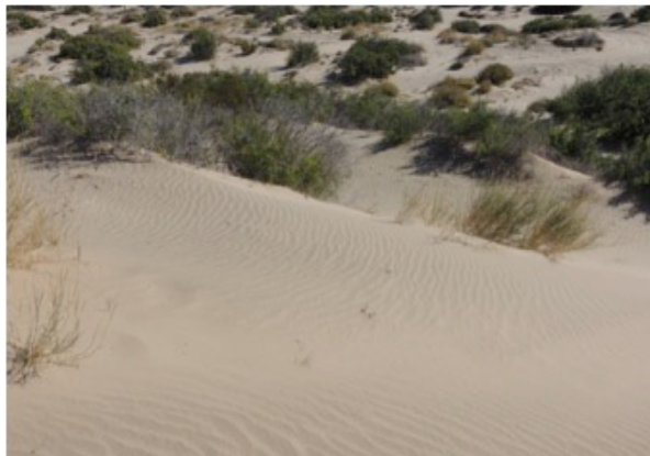
Fig. 7. Campo de dunas de San Felipe.