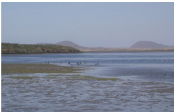
Fig. 11. Panorámica de la Bahía San Quintín, con gansos canadienses en primer plano y los volcanes al fondo.