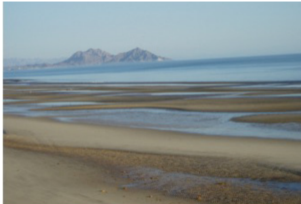
Fig. 6. Vista de las playas de San Felipe.