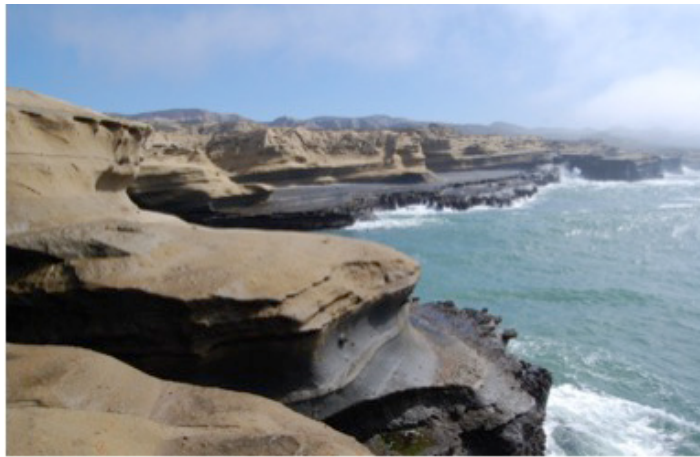
Fig. 8. Rocas sedimentarias del Cretácico, en la costa Pacífico.

por rocas graníticas y una secuencia de rocas volcánicas, metamórficas y volcano-sedimentarias del arco de la Formación Alisitos del Cretácico (Fig. 9). A su vez, sobre éste descansan discordantemente depósitos sedimentarios pobremente consolidados de la Formación Rosario del Cretácico Tardío (DELGADO 2000). Durante el Paleoceno se erosionaron los volcanes y la costa noroccidental de Baja California fue objeto de levantamientos tectónicos que dieron origen a una serie de terrazas marinas expuestas en diversas partes de la costa (GASTIL et al. 1975).