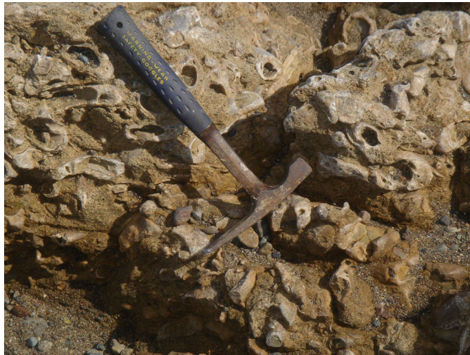
Fig. 10. Arrecifes de rudistas del Cretácico Coralliocama orcutti (WHITE, 1885).

Faro San José, y en Lomas Tetas de Cabra; en las facies continentales se han reportado fósiles de mamíferos terrestres (NOVACEK et al. 1991). En general, el Desierto Central representa lo más espectacular del paisaje por su rica flora desértica, en la que destacan el cardón ( Pachycereus pringlei ) y el icónico cirio ( Fouquieria columnaris ). Culturalmente concentra una gran cantidad de sitios arqueológicos, destacando el arte rupestre, particularmente en Las Pintas, Cataviña, Montevideo y Mesa del Carmen.