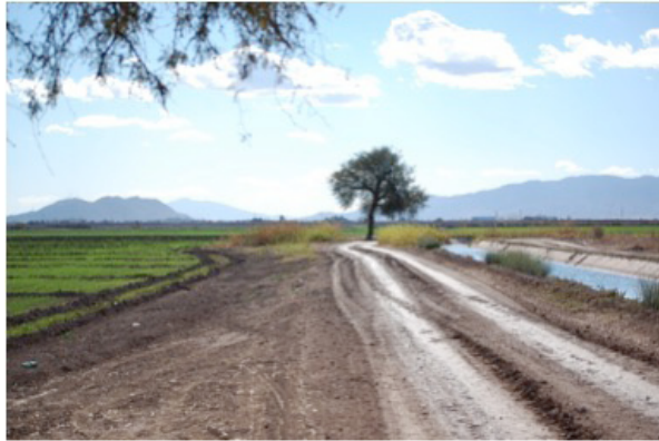
Fig. 5. Valle agrícola de México, de izquierda a derecha, el volcán Cerro Prieto y las sierras El Mayor y Cucapá, al fondo.