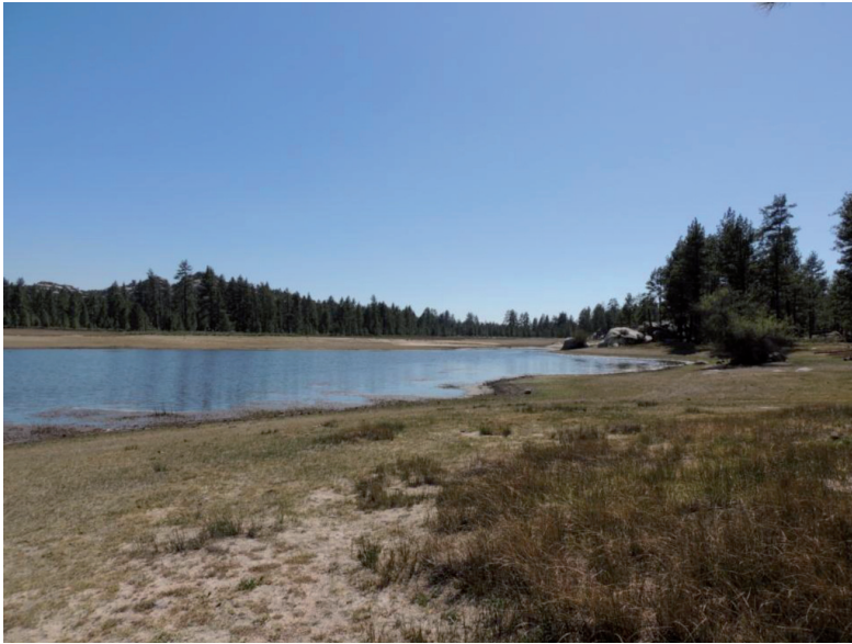
Fig. 3. Laguna Hanson, en la Sierra Juárez.