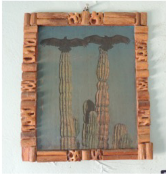
Fig. 12. Un ejemplo del uso sustentable de los recursos naturales.