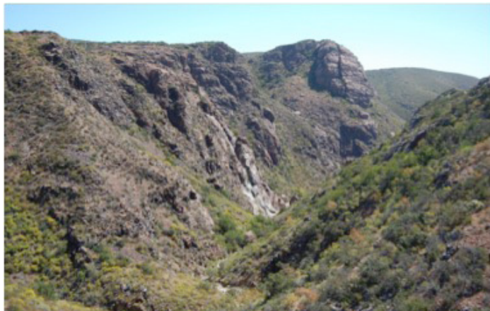
Fig. 9. Rocas volcánicas cretácicas del arco Alisitos en la región costera de la pendiente del Pacífico.