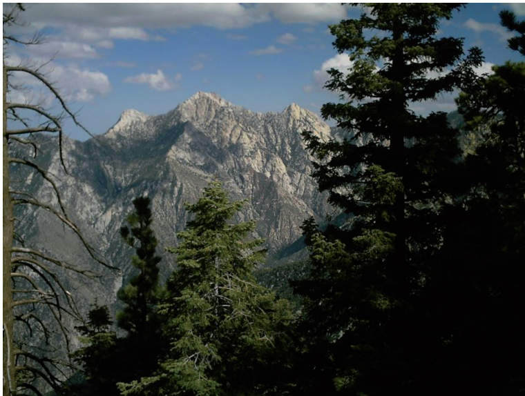
Fig. 4. Panorámica del Picacho del Diablo, en la Sierra de San Pedro Mártir.